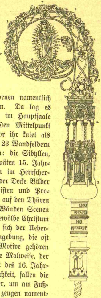
Abb. 121. Einfassung der Krümme des Bernwards-Stabes.

Daß hinter den Werken der Plastik und Malerei die kirchliche Kleinkunst nicht zurückblieb, zeigen zwei kostbare Kleinode des Domes: das Kapitelsiegel vom Jahre 1480