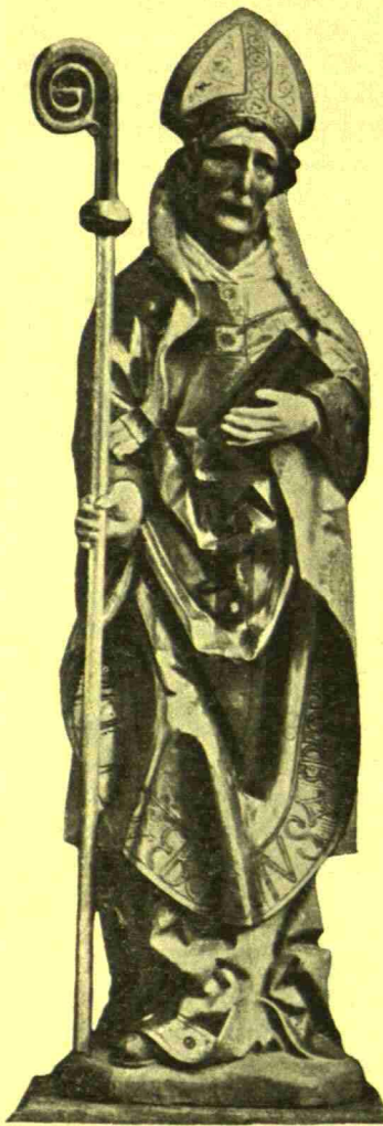
Abb. 118. St. Epiphanius. Spätgotische Holzstatue in der bischöflichen Curie.

Groß war im ganzen Mittelalter das Vertrauen zu den Patronen des Bisthums und der Pfarrkirche. „Unsere heiligste Hauptherrin, — so schrieb 1482 der Rath von