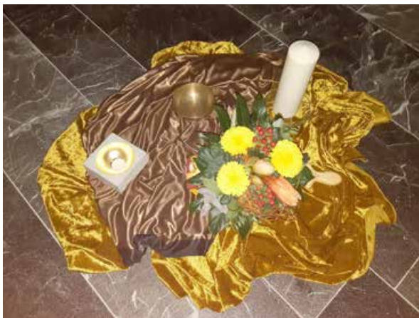
Workshop Segen ist ein Geschenk