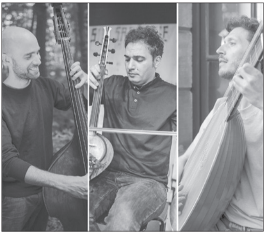
© Jana Türlich & Anne-Sophie Maleissa