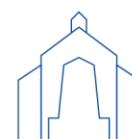
St. Joseph Delligsen