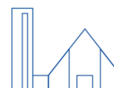
Guter Hirt Duingen