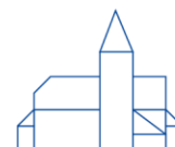
St. Bernward Everode