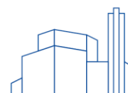
St. Marien Alfeld