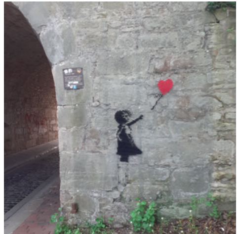
Newsletter RU-Hildesheim aktuell